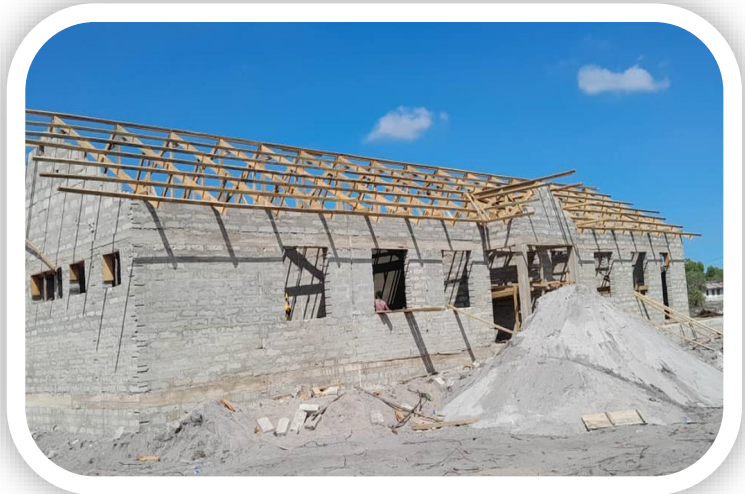
Jengo la Utawala Katika Shule ya Mkamba

hatua ulipofikia mradi kwasasa ni kupau, kufunika mashimo ya maji takaMradi pia utaongeza wigo wa upatikanaji wa Elimu kwa Wananchi wa Manispaa ya Kigamboni.