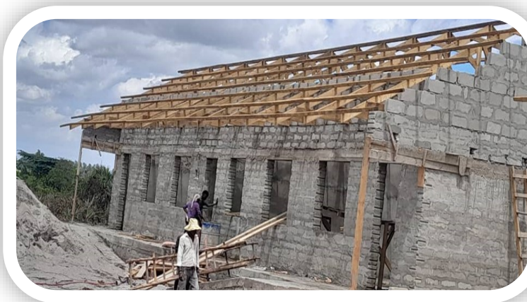
Muonekano wa vyumba 2 vya Madarasa na Ofisi 1, Shule ya Mkamba