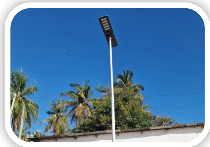
Miundombinu ya Jengo la Madarasa na Ofisi katikati Shule ya Mbutu