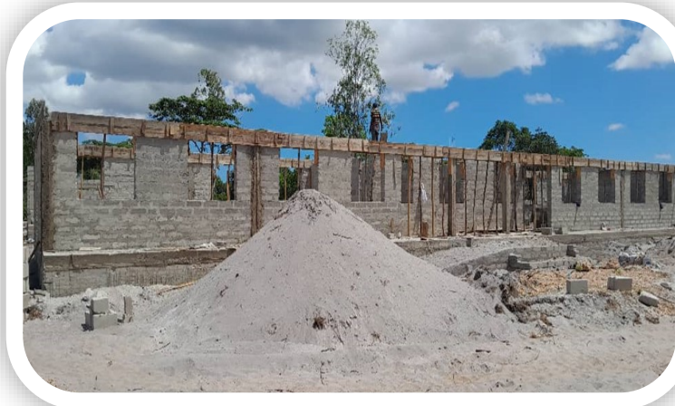
Muonekano wa Jengo la TEHAMA (Kompyuta room), Shule ya Mkamba