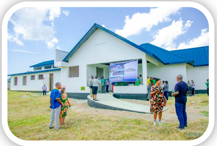
Muonekano wa mbele wa Machinjio ya kisasa ya Bamba

manufaa ya mradi huu ni Kuongeza mapato ya Halmashauri, Uhakika wa usalama wa nyama utakuwa rahisi hivyo walaji kupata nyama safi na salama, Ajira kwa wananchi kwenye mnyororo mzima wa thamani na kupunguza gharama kwa wafanyabiashara wa Kigamboni