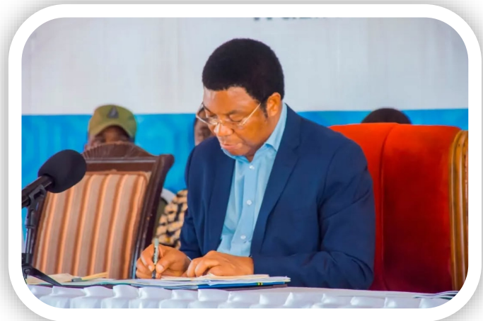
Waziri wa Jamhuri ya Muungano wa Tanzania Mhe. Kasim Majaliwa akizungumza na wananchi katika uwanja wa Mjimwema

Na kufaya taa zilizofungwa katika maeneo hayo kufikia 67 kuwekwa katika maeneo hayo. Uongozi wa Wilaya ya Kigamboni unatoa wito kwa Wanachi wote kutunza na kuzilinda taa hizo ili shughuli za uzalishaji ziendeleo kufanyika kwa maasaa yote