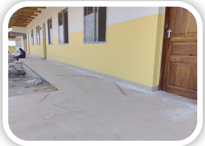
Miundombinu ya Jengo la Madarasa na Ofisi katikati Shule ya Mbutu