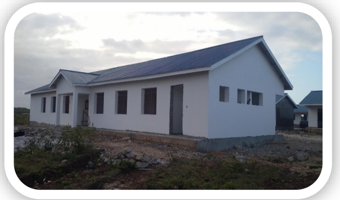
Miundombinu ya Jengo la vyumba viwili vya Madarasa katika Shule ya Sekondari ya Mbutu

Mradi pia utaongeza wigo wa upatikanaji wa Elimu kwa Wananchi wa Manispaa ya Kigamboni .