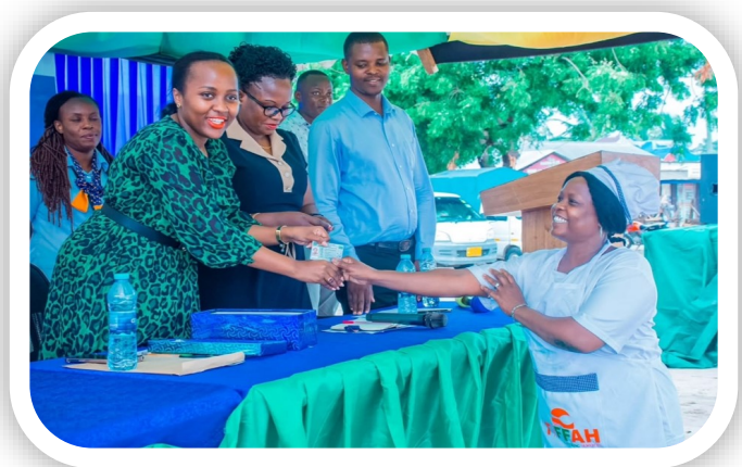
Mama lische akipokea kitambulisho cha kidijitali cha mfanyabiashara ndogo ndogo (Machinga)

Aidha ili kujisajili na kupata kitambulisho hicho muombaji anapaswa kuwa na namba ya kitambulisho cha taifa (NIDA) barua ya utambulisho kutoka A Serikali ya Mtaa na kulipia kiasi cha Tsh 20,000/= mfumo huu unatarajia kuchochea ukuaji wa uchumi kuboresha ustawi wa wafanyabiasharra ndogo ndogo ndani ya Wilaya ya Kigamboni