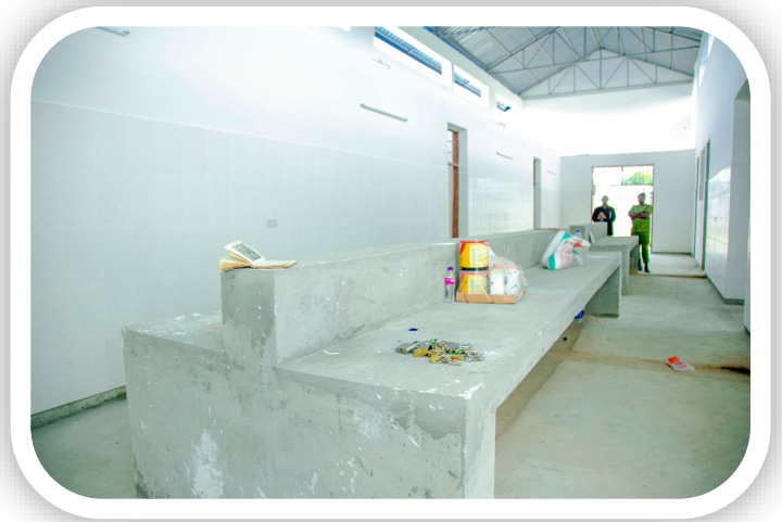
Muonekano wa Ndani wa Machinjio ya kisasa ya Bamba