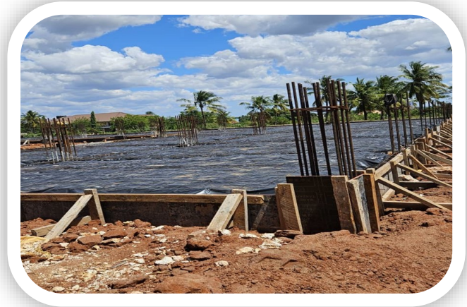
MUONEKANOWA JENGO LA WODI YA WAKINA MAMA WAJAWAZITO KATIKA HOSPITALI YA VIJIBWENI

Utekelezajai wa mradi huu unafanywa kwa njia ya Nguvu kazi (Force akaunt) na kwa sasa utekelezaji wa mradi huu umefikia asilimia 35 ya utekelezaji kwa awamu hii ya kwanza, ambayo ilianza Tarehe. 18/04/2024 na hatua iliyofikiwa kwa sasa