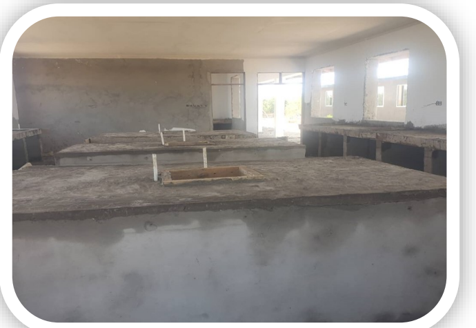
Miundombinu ya Jengo la Maabara ya Biolojia Shule ya Mbutu