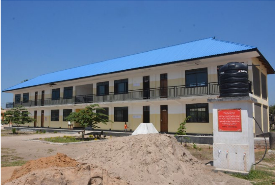
Shule ya Sekondari Paul Makonda iliyopo kata ya Kigamboni ikiwa imekamilika na kuruhusu wanafunzi wa kidato cha kwanza kuingia mwaka 2020.

Kuanzia mwaka 2016/17 hadi June 2020 Serikali ya awamu ya tano imetekeleza miradi ya Elimu ya sekondari yenye thamani ya Tsh. 2,993,491,061.29 Jumla ya madarasa 22 yamejengwa na madarasa 71 kukarabatiwa kwa gharama ya Tsh.526,869,392.59 na Tsh.26,552,327.00 zimetumikakatika ukarabati wa maabara ya shule ya Sekondari Aboud Jumbe na milioni 18 ukarabati wa maabrara ya Nguva Sekondari.