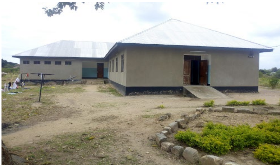
Moja ya Bweni la wanafunzi wa Kiume wa Kidato cha Tano Shule ya Sekondari Nguva

Ujenzi wa Sekondari mpya ya Paul Makonda iliyopo Kata ya Kigamboni umesaidia watnafunzi kupata Shule karibu na makazi yao pia kuiwezesha Kata ya Kigamboni kupata Shule ya Sekondari ya Serikali kwani ni Kata pekee katika wilaya nzima ya Kigamboini ambayo haikuwa na Shule ya Kata ya Sekondari.