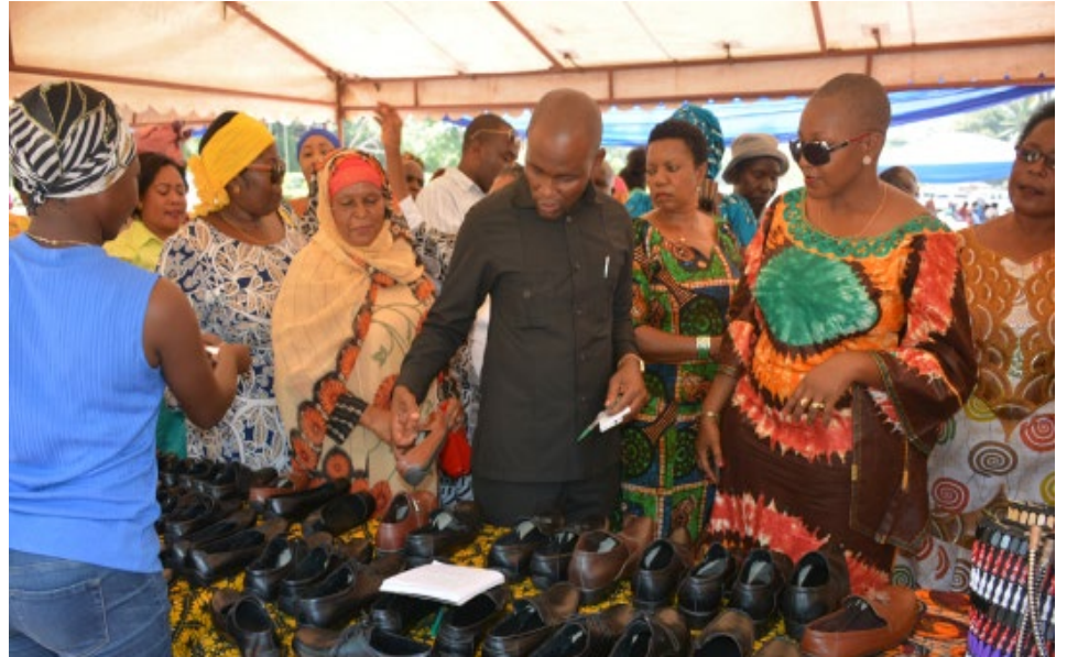
Mbunge wa Wilaya ya Kigamboni Mhe. Faustine Ndungulile alipotembelea kuona bidhaa zinazozalishwa na wanawake kwenye hafla ya kuwezesha wanawake kiuchumi iliyofanyika Mjimwema Jan 2018.

Kutambua makundi maalumu hasa watu wenye ulemavu, wanawake na vijana kuwawezesha kujikwamua kiuchumi , Kuongeza idadi ya wajasiriamali katika Wilaya na mzunguko wa fedha kwenye uchumi pamoja na Kuongeza ustawi wa jamii .