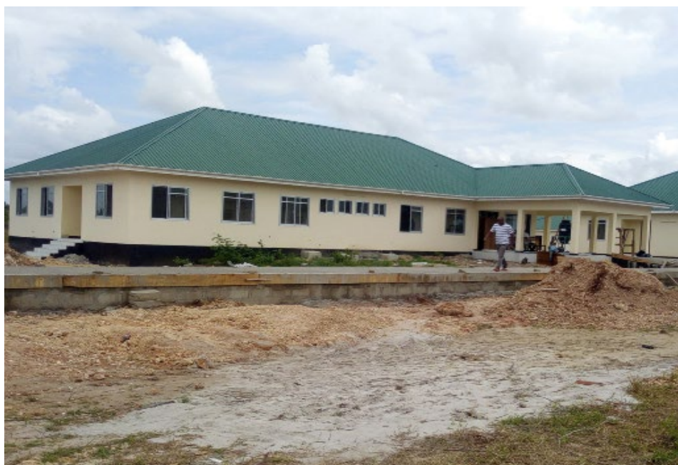
Jengo la maabara likiwa limekamilika na katikati ni ujenzi wa njia itakayounganisha na majengo mengine.

Miradi hii pia itapunguza usumbufu na gharama za usafiri ambazo wananchi walikuwa wanatumia kwenda maeneo ya mbali kufuata huduma za Afya.