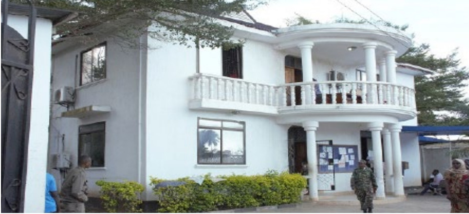
Lililokuwa Jengo la ofisi za Mkurugenzi na Mkuu wa Wilaya Mjimwema

Tangu kuanza kwa Halmashauri ya Manispaa ya Kigamboni ofisi za Mkurugenzi na Mkuu wa Wilaya kwaajili ya kutolea huduma zilikuwa za kukodi wakati utekelezaji wa ujenzi wa ofisi mpya eneo la Gezaulole Kata ya Somangila ukiendelea.