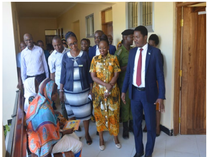
Waziri wa TAMISEMI Mhe. Selemani Jafu akizungumza na mgonjwa aliyekuja kupata matibabu kwenye Hospitali ya Wilaya alipofanya ziara ya kuona huduma zitolewazo.