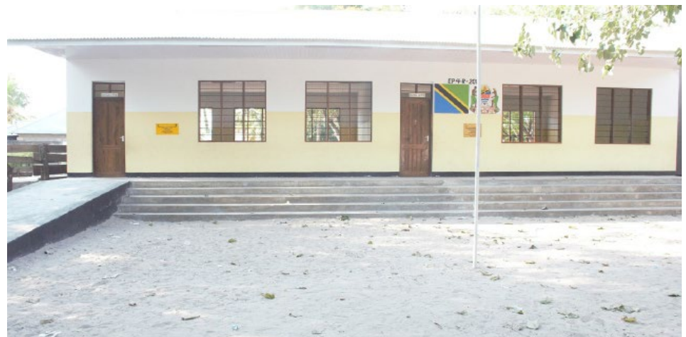
Majengo ya vyumba vya madarasa 2 (mawili) Vijibweni Shule ya Msingi yaliyojengwa kwa fedha za EP4R Lipa kulingana na matokeo

Kutokana na uboreshwaji wa miundombinu ya elimu na mpango wa elimu bure umepelekea ongezeko la wanafunzi wanaoandikishwa darasa la kwanza, kutoka 5541 kwa mwaka 2017 ikiwa ni 98% ya idadi ya wanafunzi 5628 iliyotarajiwa hadi 6071 kwa mwaka 2019 ikiwa ni 108% ya idadi ya wanafunzi 5618 iliyotarajiwa