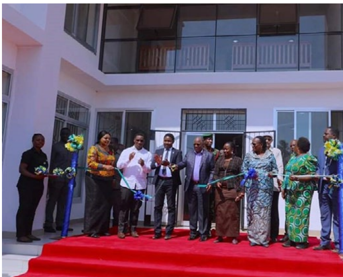
Rais wa Jamhuri ya Muungano wa Tanzania Mhe. John Pombe Magufuli akikata utepe ishara ya ufunguzi wa Wilaya ya Kigamboni uliofanyika februari 2020.