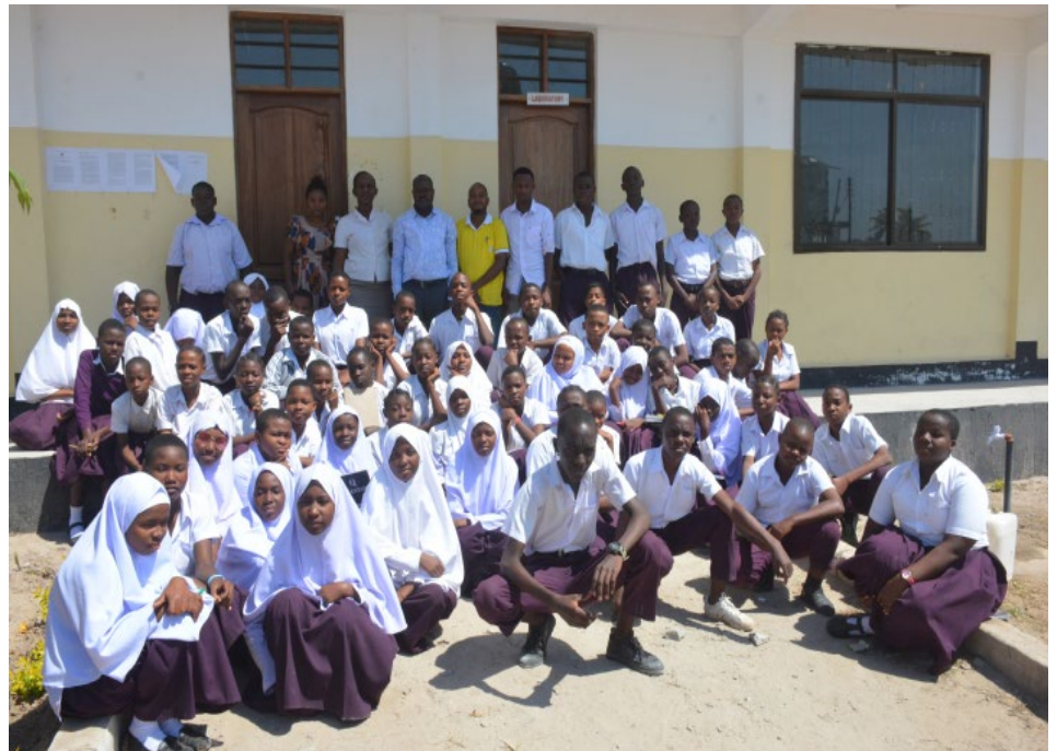
Baadhi ya wanafunzi wa kidato cha kwanza na waalimu wa Shule ya Sekondari Paul Makonda wakiwa kwenye picha ya pamoja

Majengo 3 ya utawala yamejengwa chini ya uongozi wa Mhe. Mkuu wa Mkoa wa Dar es Salaam na majengo hayo yapo hatua za ukamilishaji ambapo Serikali kuu ilichangia Tsh. 75,000,000.00