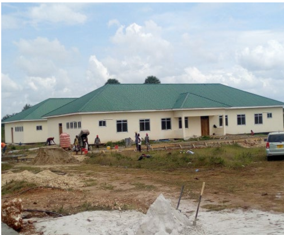
Jengo la mama na mtoto likiwa limekamilika na mafundi wakiwa wanaendelea na ujenzi wa njia zinazounganisha na majengo mengine.