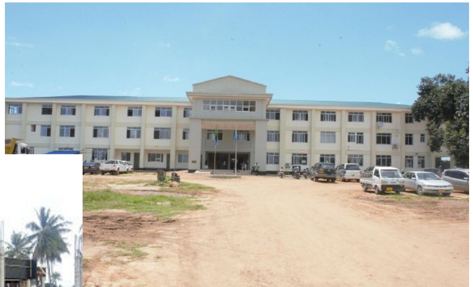
Jengo jipya la utawala la Mkurugenzi wa Manispaa ya Kigamboni lililojengwa eneo la Gezaulole Kata ya Somangila na kushoto ni ujenzi wa nyumba ya Mkurugenzi.